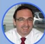
Eugênio Antunes Presidente do EMPREL - Associação Municipal de Pernambuco e do Prefeitura de Recife.

10h | Painel 02: Como o uso dos dados vem melhorando o processo de transformação digital nas grandes cidades.